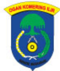
Kabupaten Ogan Komering Ilir